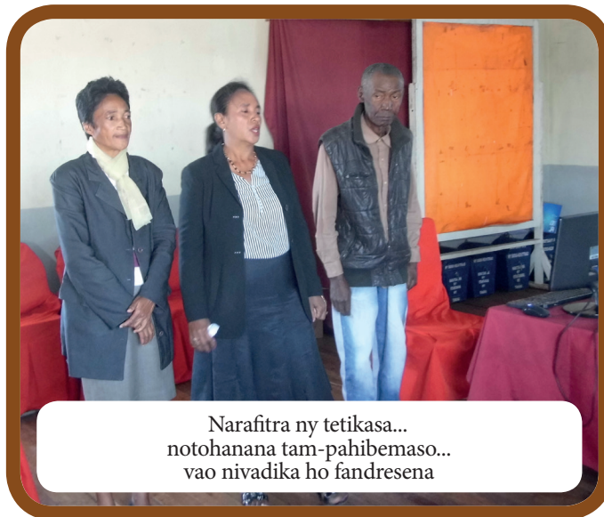
Narafitra ny tetikasa... notohanana tam-pahibemaso... vao nivadika ho fandresena