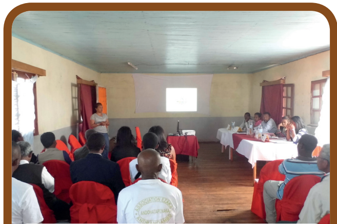
Teo anatrehan'ny vondron'ny mpitsara sy ny tompon' andraikitra ny fandaharan'asa no nifaninanana'ny rehetra.